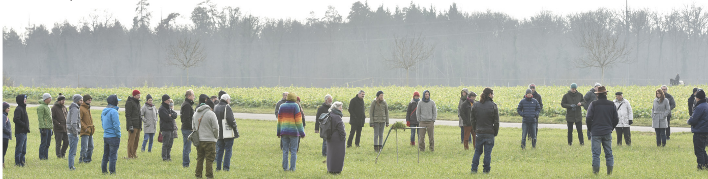
Spatendiagnose und Boden-Wahrnehmung

Projektstand berichtet und es wurden mit den Teilnehmenden wesentliche Fragen im Hinblick auf die Zukunftsperspektiven des Projekts besprochen. Wir waren berührt davon, wie verantwortungsvoll, geistig beweglich und offen die Landwirte unserer Partnerbetriebe in die Zukunft blicken. Ein ausführlicher Bericht erscheint in unserem nächsten Magazin Anfang Juni.